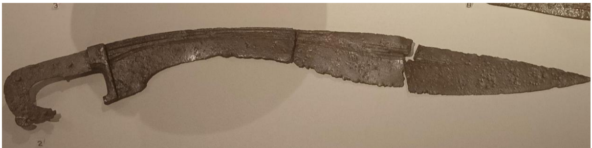
Fotografía de la Falcata expuesta en el Museo Ibero.