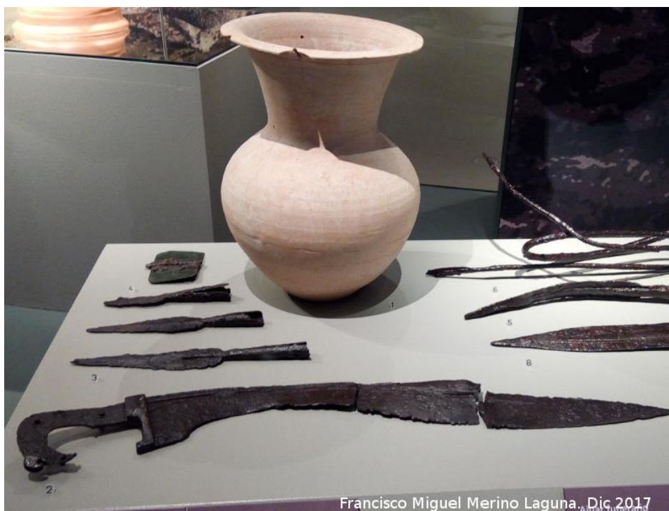
Fotografía del ajuar completo de la “Tumba de la Falcata” expuesto en el Museo Ibero. Elaboración de Francisco Miguel Marino Laguna, 2017.

Por último en el ajuar encontramos un posible broche de cinturón, de bronce, bastante desgastado.