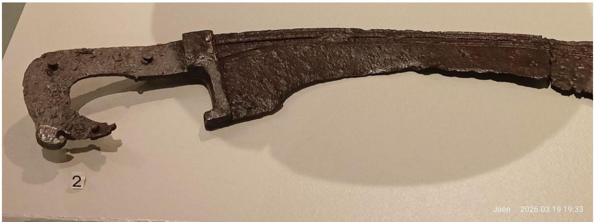
Fotografía en detalle de la guarnición y tercio fuerte de la Falcata expuesta en el Museo Ibero. Elaboración propia.