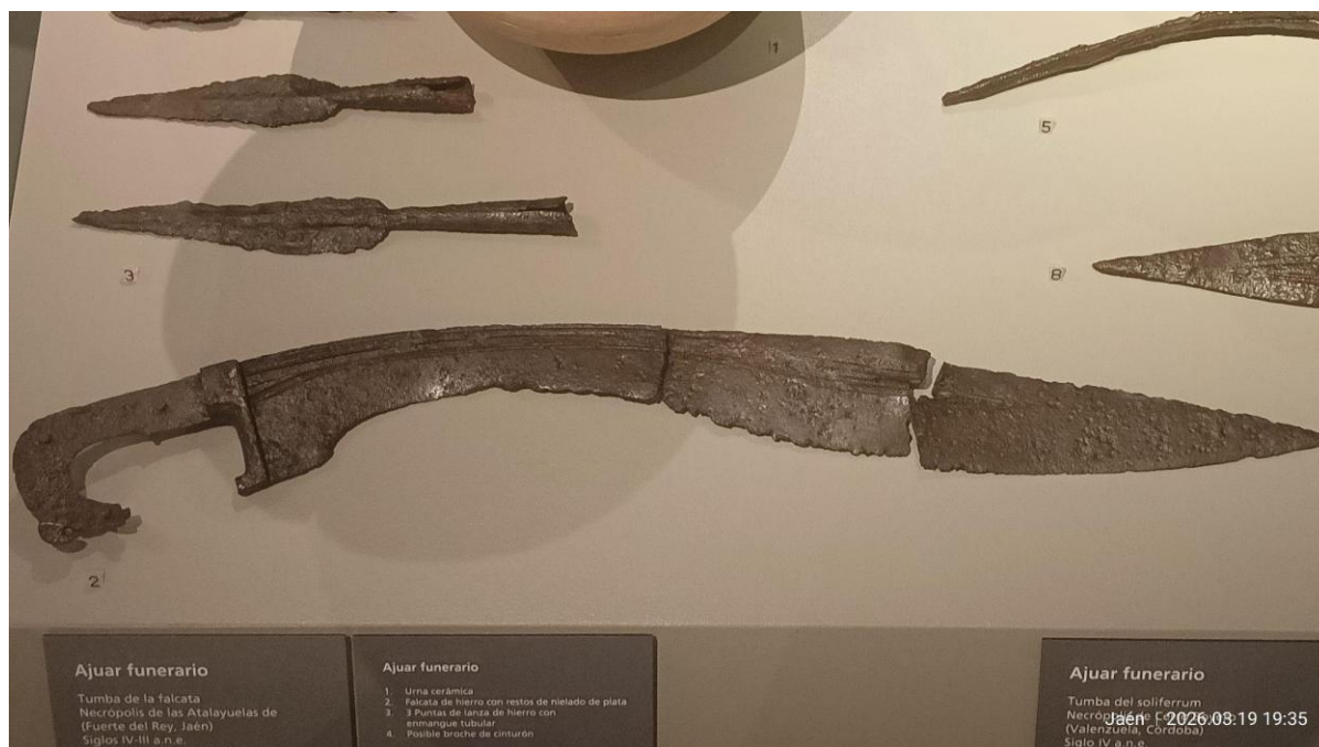
Fotografía de la Falcata expuesta en el Museo Ibero. Elaboración propia.