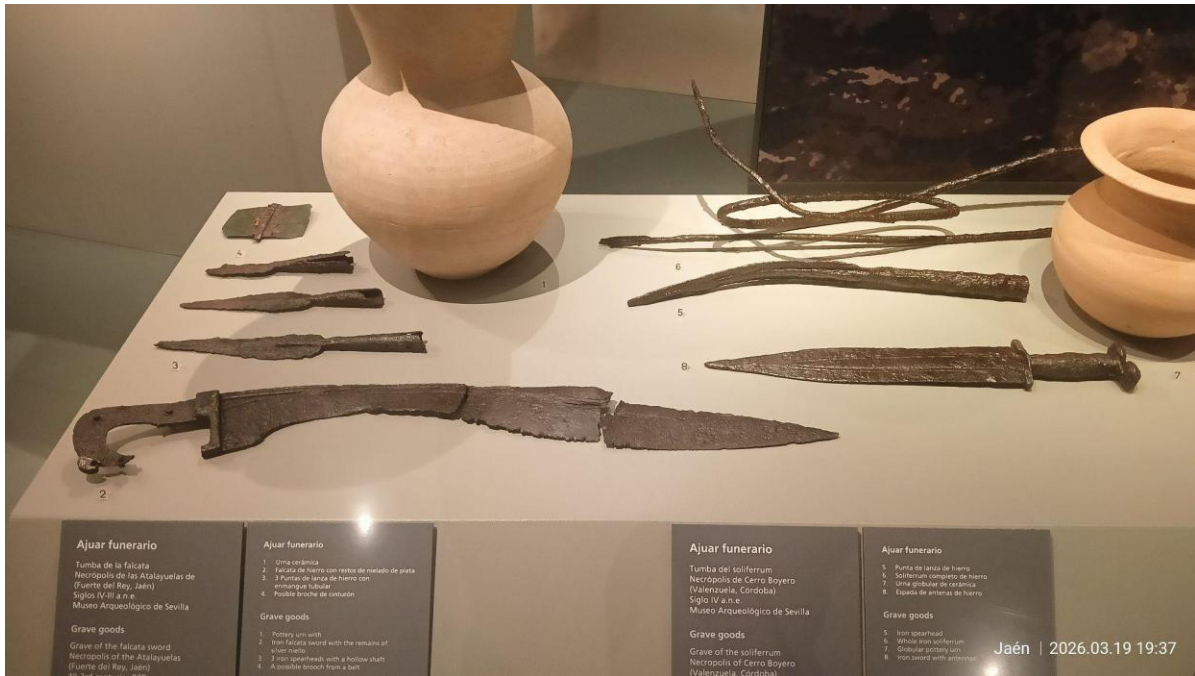
Fotografía del Ajuar de la Tumba de la Falcata expuesto en el Museo Ibero.